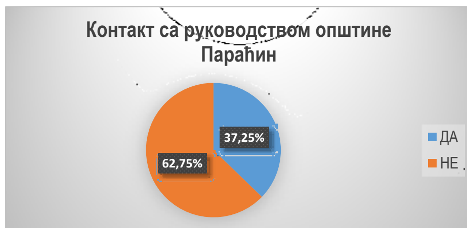
График 2: сарадња привреде са руководством општине

Од 51 испитаника, 37,25% је одговорило да је имало контакт са руководством општине, док је 62,75% одговорило да није имало контакт са руководством, општине. Одговори испитаника који су остварили контакте са руководством општине су учешће у привредном савету општине, сарадња око планова и пројеката, одржавање путне инфраструктуре и подстицање и проширење парцела и инвестирање.