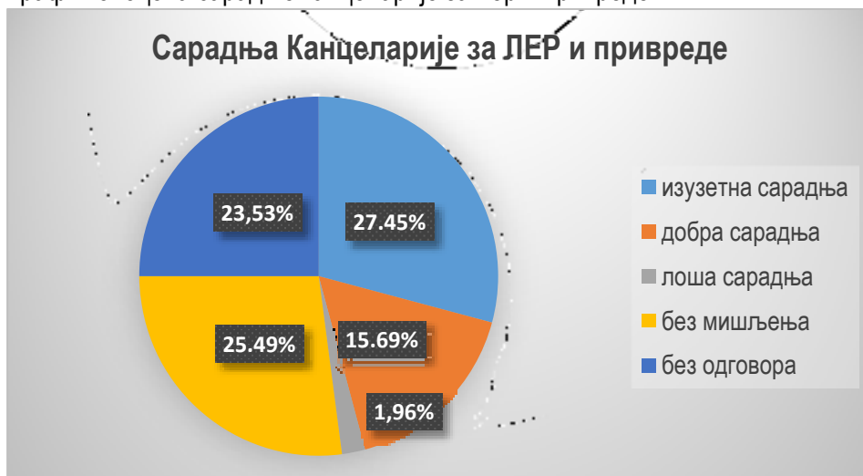
График 5: оцена сарадње канцеларије за лер и привреде

Изузетну сарадњу са канцеларијом за лер има 27,45% испитаника, добру сарадњу има 15,69% испитаника, одговор задовољава дало је 5,88% испитаника, лошу сарадњу има 1,96% испитаника, без мишљења је 25,49 %, док на питање није одговорило 23,53% испитаника.