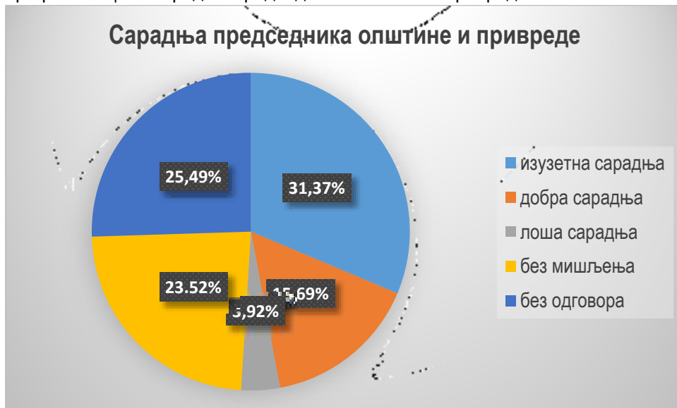
График 3: оцена сарадње председника општине и привреде

Изузетну сарадњу са председником општине има 31,37 % испитаника , добру сарадњу са председником општине има 15,69% испитаника, лошу сарадњу са председником општине има 3,92% испитаника, без мишљења је 23,52 % испитаника, док на питање није одговорило 25,49% испитаника.